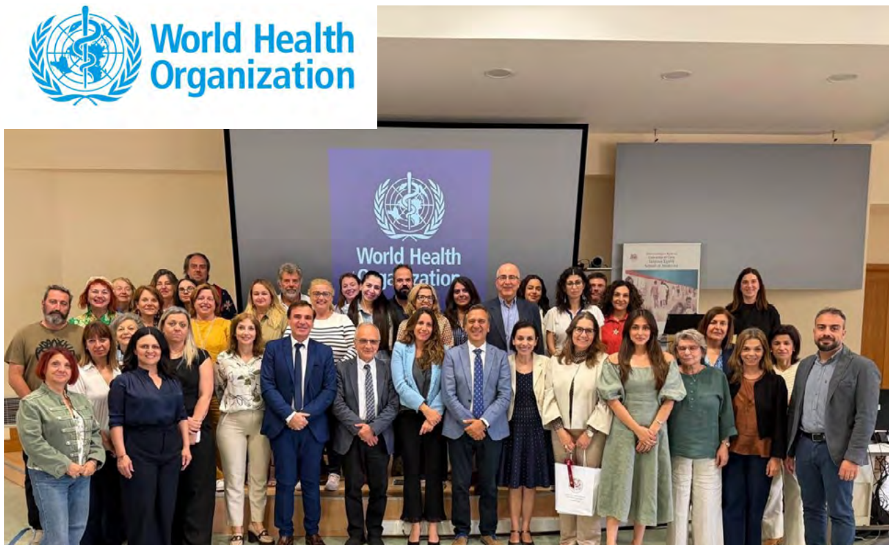
Αναμνηστικό στιγμιότυπο κατά την ολοκλήρωση της εκδήλωσης

Μ ε ιδιαίτερη επιτυχία πραγματοποιήθηκε, στις 19 Μαΐου 2026, η επίσημη τελετή έναρξης λειτουργίας της Ιατρικής Σχολής του Πανεπιστημίου Κρήτης ως Συνεργαζόμενου Κέντρου του ΠΟΥ (WHO Collaborating Centre) για την Ποιότητα Φροντίδας και τις Ανθρωποκεντρικές Πολιτικές Υγείας, για τα επόμενα τέσσερα έτη.