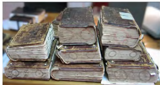
Κρήτες Κωδικογράφοι: γύρω από τον Μιχαήλ Αποστόλη 2η Διάλεξη

Η Εθνική Βιβλιοθήκη της Ελλάδος (ΕΒΕ) και το Εργαστήριο Παλαιογραφίας του Πανεπιστημίου Κρήτης συνδιοργάνωσαν τη 2η διαδικτυακή διάλεξη του κύκλου «Κρήτες Κωδικογράφοι: γύρω από τον Μιχαήλ