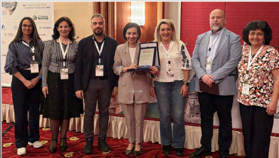
Αναμνηστική φωτογραφία μετά τη βράβευση της Ιατρικής Σχολής του Πανεπιστημίου Κρήτης για τη διαχρονική αριστεία και προσφορά της στην επιστήμη και την κοινωνία

Η συμμετοχή του Πανεπιστημίου Κρήτης στο 17ο Παγκρήτιο Φαρμακευτικό Συνέδριο, με τίτλο «Το μέλλον της Υγείας περνά από το φαρμακείο», υπήρξε ιδιαίτερα δυναμική. Το Συνέδριο πραγματοποιήθηκε στις 16–17 Μαΐου 2026 στο Ηράκλειο Κρήτης με μεγάλη επιτυχία.