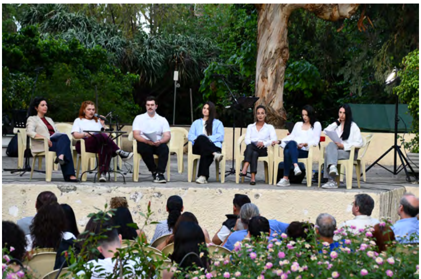
Φωτογραφικά στιγμιότυπα από την εκδήλωση