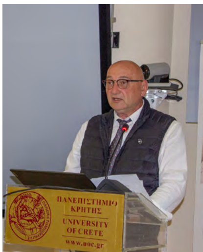
Ο Πρύτανης του Πανεπιστημίου Κρήτης Καθηγητής Γεώργιος Μ. Κοντάκης