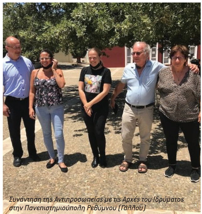
Συνάντηση της Αντιπροσωπείας με τις Αρχές του Ιδρύματος στην Πανεπιστημιούπολη Ρεθύμνου (Γάλλου)

Κάθε συνάντηση κρίθηκε ουσιαστική και γόνιμη για το ξεκίνημα μιας μακράς και πολυεπίπεδης συνεργασίας, με εφελκυστήρι τις μεγάλες δυνατότητες που προσφέρει το πρόγραμμα Erasmus+ στα Πανεπιστήμια εντός κι εκτός Ευρώπης.