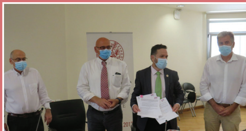
Στιγμιότυπα από τη συνάντηση για την Υπογραφή του Συμφώνου Συνεργασίας των δύο Πανεπιστημιακών Ιδρυμάτων